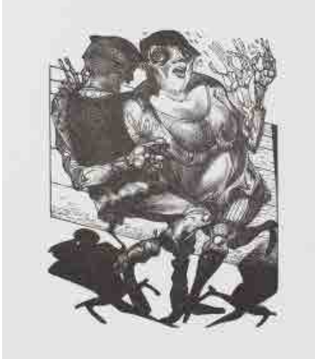
Holzstich aus: Totentänze: Holzstiche, Gedichte, Folge 3; Peter Gosse, S. 27. © VG Bild-Kunst, Bonn 2018