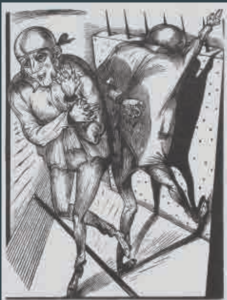
Titelseite: Friss die Reste des Vergessens, burgart-presse