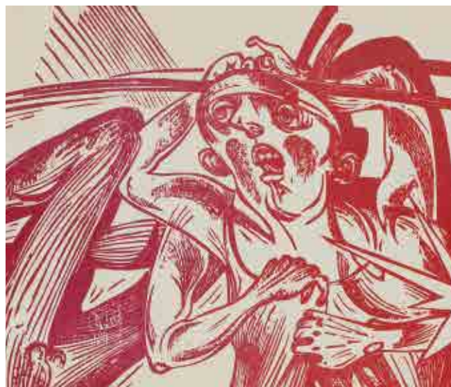
Sicheln, Sensen & Flaggen. Edition ZWI 15 © VG Bild-Kunst, Bonn 2018

Und mit welchem eminentem Glanz er freilich seine Bild-Gegenstände nobilitiert, wie er sie mit vibrierensfähiger Lineatur-Sanftmut begabt, sodass noch die Melancholie sich von hoffender Ergriffenheit überwölbt findet! Wie doch dieser Künstler, im Atelier zu Füßen des ehrfurchtgebietenden sächsischen Rochlitzer Berges, kaum Vereinbares vereint: Virtuosität und Beseeltheit – er führt sie eng! Das Kunst-Schöne, so beweist er – noch misslicher Realität gewinnt es jenes auratische Strahlen ab, das der Humanitas eignet.“