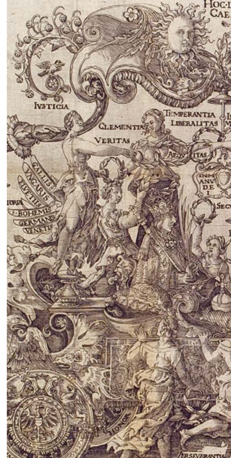
Albrecht Dürer: Der Große Triumphwagen, → verkleinerte Kupferstichkopie, 1606

Auch die Wolfenbütteler Bibliothek ist als ursprünglicher Aufbewahrungsort von Kupferstichen und Schriften Dürers ein wichtiges Zentrum derartiger Rezeption. Die Welfenherzöge Heinrich Julius und August d. J. sowie dessen Kinder und Enkel nehmen an der Dürermanie ihrer Zeit teil und prägen sie durch ihre persönlichen Vorlieben über mehr als 200 Jahre. In der Ausstellung wird diese Dürerbegeisterung der Welfen auf unterschiedlichen Ebenen dargestellt: in zahlreichen Kunstwerken, in den Schriften Dürers und in einer Reihe von Gegenständen, die die Person und das Leben des Künstlers thematisieren. Die Umstände der Erwerbung dieser Stücke und ihre Inszenierung spiegeln die hohe Wertschätzung für den Nürnberger Meister, der zu einem der bedeutendsten Vertreter nationaler Kultur stilisiert wurde.