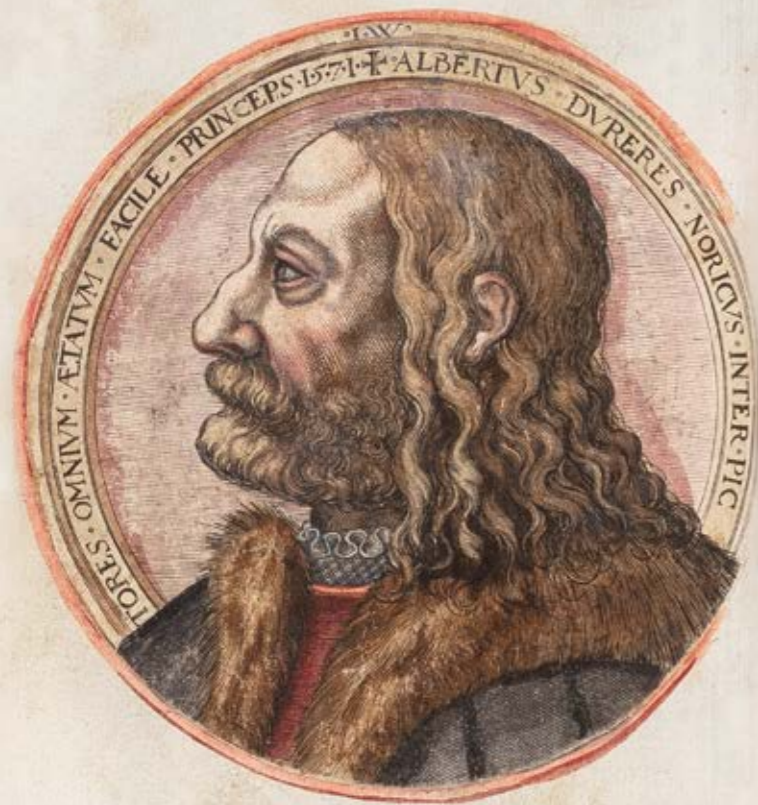
Johann Wierix: Brustbild Dürers im Profil, Kupferstich, 1571