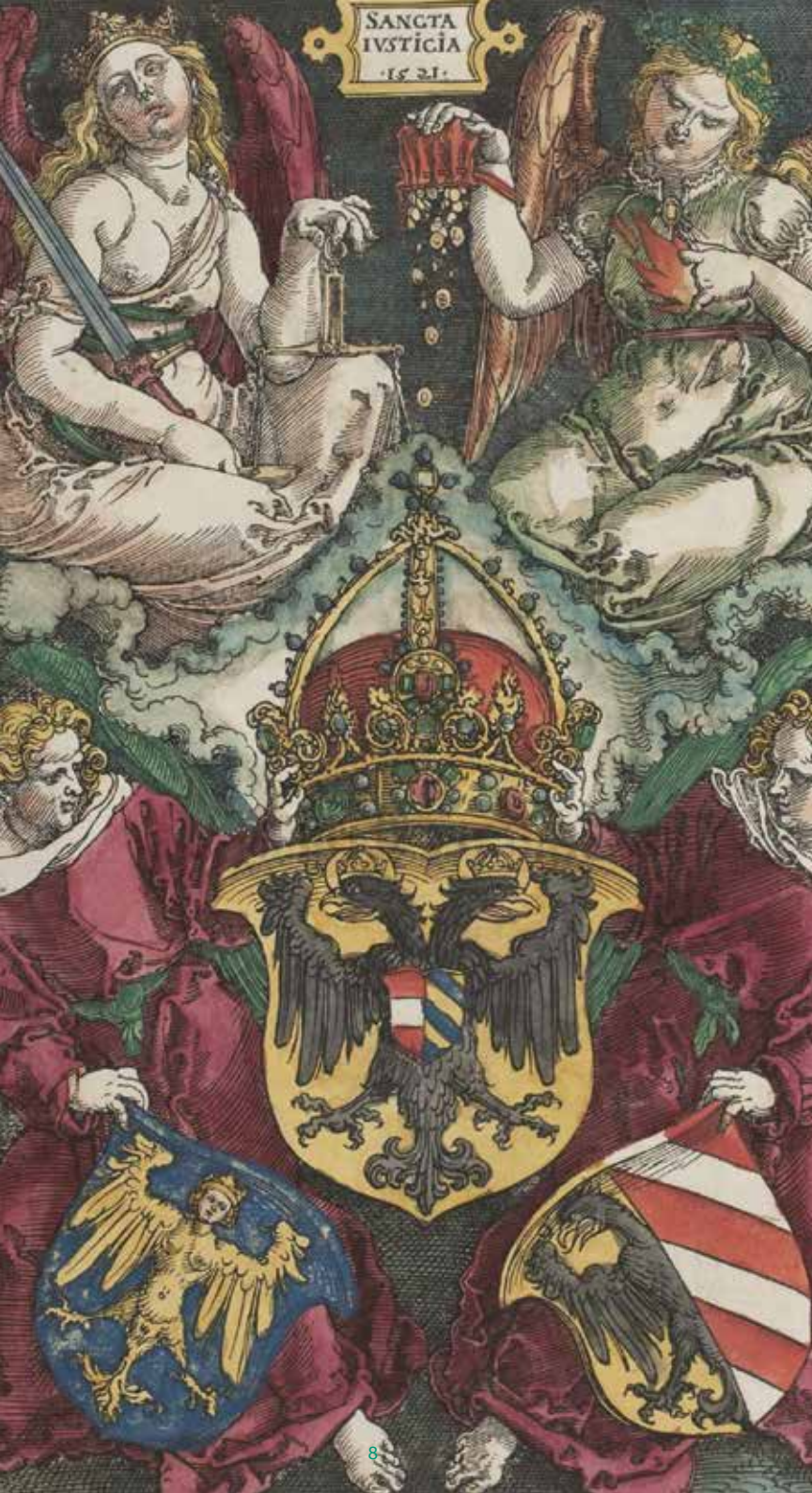
← Albrecht Dürer, Sancta Iusticia, Allegorie mit den Wappen des Reiches und der Stadt Nürnberg, 1521, Holzschnitt