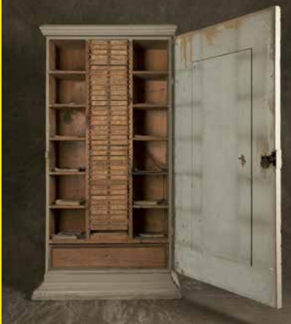
Frühneuzeitlicher Zettelkasten aus der Universitätsbibliothek Helmstedt, 15. Jahrhundert