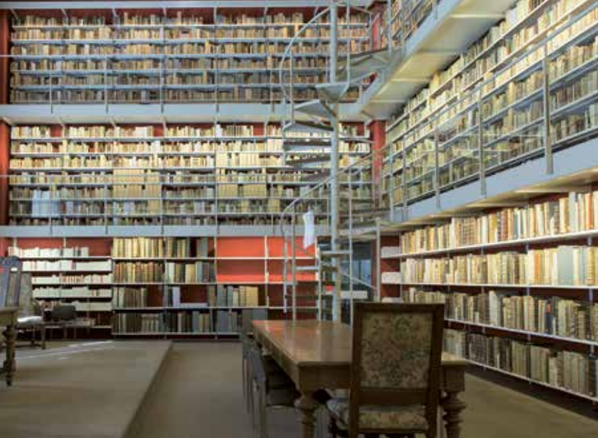
Sammlung Deutscher Drucke in der Bibliotheca Augusta