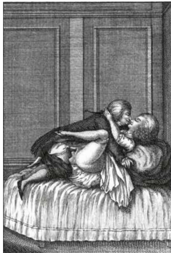
Frontispiz des anonymen, vorgeblich im (fingierten) Verlag von »Peter Hammer« erschienenen Romans Angelika (1797), einer freien Bearbeitung von La Tourière des Carmélites (1745).

Nelly Sachs und Paul Celan, bedeutende Lyriker des 20. Jahrhunderts, waren miteinander befreundet. Beider Werk ist wesentlich vom Holocaust geprägt, ein Thema, das in immer neuen Formen zur Sprache gelangt. Gelesen werden Gedichte und Auszüge aus der gemeinsamen Korrespondenz.