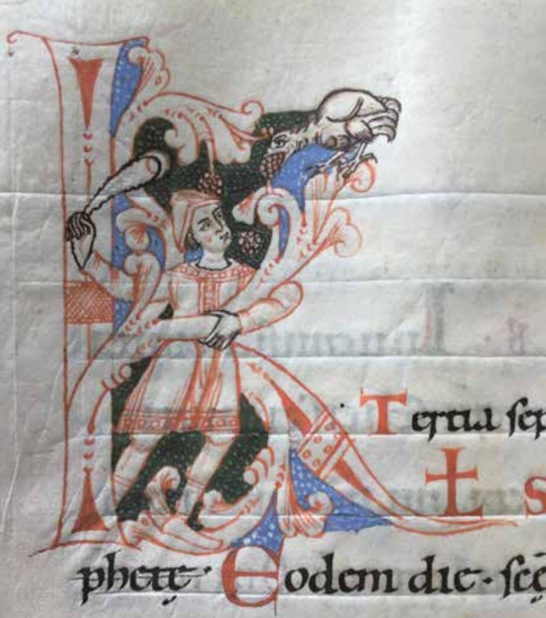
Martyrologium, Consuetudines monasticae und Benediktinerregel, Weißenburg, letztes Viertel 11. Jahrhundert