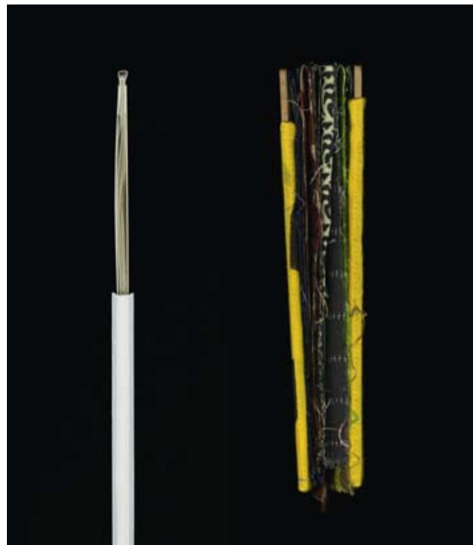
andere Ansichten (Foto: CTL-Press)

Bild oben links und Vorderseite: aus OnniSanti, Edizioni CTL 2008